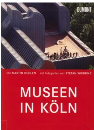
Martin Oehlen (Text) Stefan Worrning (Fotografien) Museen in Köln.

DuMont Literatur & Kunst Verlag. Köln 2004