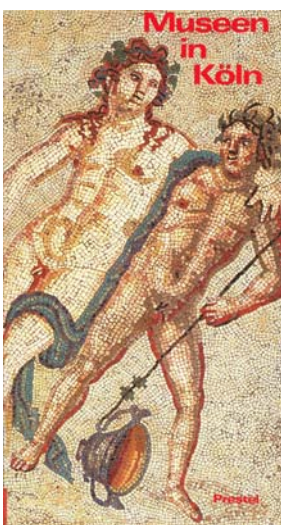
Hugo Borger (Hrsg.) Museen in Köln - Ein Führer durch 26 Museen und Sammlungen Prestel-Verlag München 1986

Eine Kurzbiographie über eine mit dem entsprechenden Museum verbundene Persönlichkeit rundet die Darstellung ab. Dabei kann es sich um einen Künstler des Hauses, um einen bekannten Sammler oder um den Architekten des Museumsbaus handeln. In zwei Fällen stehen historische Persönlichkeiten im Mittelpunkt, die charakteristisch sind für dieses Museum, wie Agrippina die Jüngere für das Römisch-Germanische Museum und Rainald von Dassel für die Domschatzkammer. Zum Stadtmuseum werden zwei Persönlichkeiten vorgestellt, die zwar nie gelebt haben, trotzdem aber zu den bekanntesten und beliebtesten Kölnern gehören, zum Deutschen Sport & Olympia Museum eine, die nicht einmal menschlich ist! Um wen es sich handelt? Lesen Sie selbst!