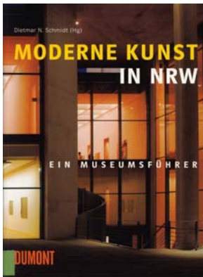
Dietmar N. Schmidt (Hrsg.) Moderne Kunst in NRW Ein Museumsführer DuMont Köln 2003

Neben dieser Auswahl an Führern, die sich auf Köln und die nähere Umgebung beschränken, gibt es auch solche, die ganz Nordrhein-Westfalen einbeziehen. Zwei sind in letzter Zeit in Kölner Verlagen erschienen.