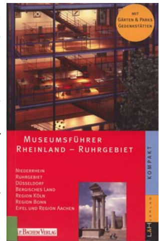
Julia Vatter-Zipelius Museumsführer Rheinland-Ruhrgebiet L & H Verlag Hamburg / J. P. Bachem Verlag Köln 2002

Obwohl dieser Führer sich auf die Moderne Kunst beschränkt (beginnend ca. 1870), kommen doch eine Reihe von Einrichtungen zusammen, die auf ähnliche Weise wie im oben erwähnten Führer von Martin Oehlen aus dem gleichen Verlag beschrieben werden.